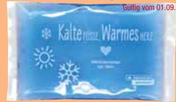
Heiß-kaltes Lieblingsstück Egal ob warm oder kalt, mit dieser Mehrfachkompressen bist Du immer gut aufgestellt.

Einmalig einlösbar. Nur ein Gutschein pro Einkauf.